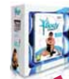
Jeu Wii My Body Coach