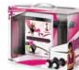
Jeu PS3 My Body Coach